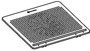
Notebook Cooler x 1